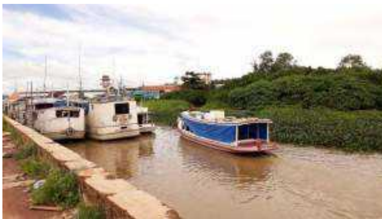
Imagem 2. Embarcação chegando no porto, 2023.

A população ribeirinha chega nesse espaço urbano da cidade, de diferentes comunidades e de diferentes regiões, chamadas de “interior” pelas águas do Rio Amazonas que adentra no igarapé. Como mostra a Imagem 2 onde mostra uma embarcação típica da região amazônica adentrando no porto do Igarapé das Mulheres.