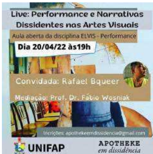
Figura 2. Folder da aula aberta na disciplina de ELVIS IV – Performance.

Para as primeiras aulas, foi realizado um convite para uma aula aberta com Rafael Bqueer, uma artista que nasceu em Belém/PA, que tem o corpo como suporte e pesquisa, atravessando diversas questões raciais, de gênero, e descolonização nas artes visuais, escolas de samba e cena drag-themônia da Amazônia. É artista multidisciplinar, sua produção se desdobra em performance, vídeo, fotografia, cinema e arte-educação.