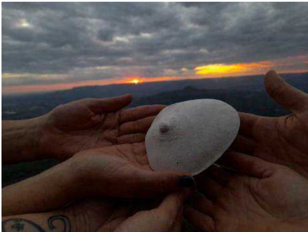
Imagem 01: Catuscia Dotto. Monumento III, E hoje estamos sozinhas aqui! - Série Monumentos para um feminino violado , 2021. Réplica em gesso do seio da artista nas mãos das mulheres que me acompanharam na expedição de instauração do monumento. Cume do Morro Botucarái – Candelária–RS.

acorparmos” (MARTÍNEZ, 2022, p. 143). Portanto, narrar a experiência singular quanto corpo feminino em trânsito no espaço público, evidenciando a violência a qual ficamos expostas, significa endossar a narrativa de todos os corpos femininos que desejam circular livremente.