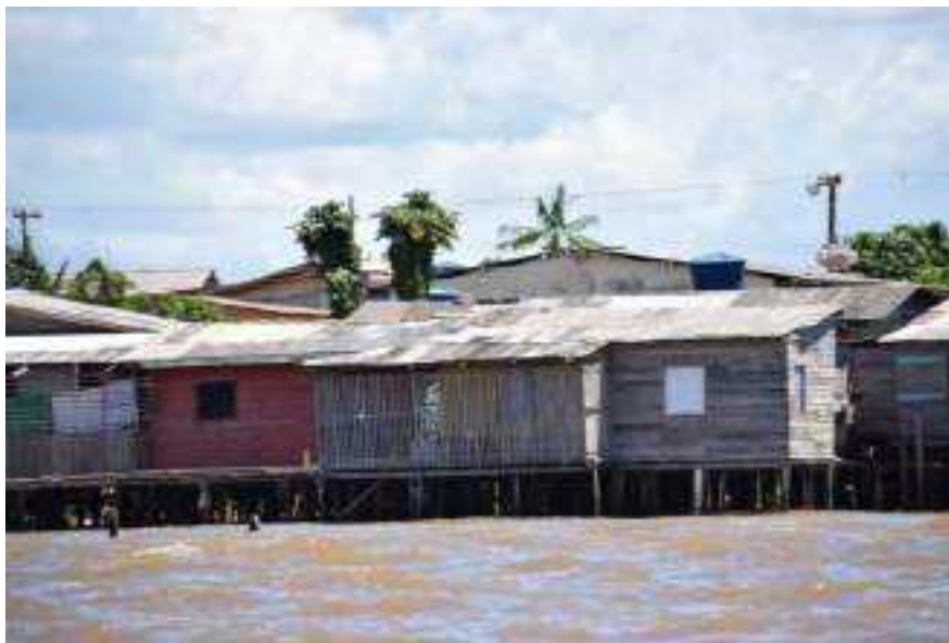
Proximidades do Canal do Jandiá. Visão do Rio, Amazonas para a cidade. Zona leste de Macapá. Arquivo de pesquisa.