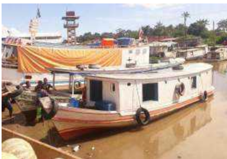
Imagem 4. A dificuldade de sair do igarapé, 2023.

Tive a oportunidade de fazer o registro dessa circunstância que o ribeirinho vivencia contidamente no igarapé, como mostra a Imagem 4 em que na cena temos algumas pessoas no leito do igarapé empurrando uma embarcação, na seca da maré, até o meio do canal para que tenha condições da embarcação seguir viagem. O assoreamento do canal do Igarapé das Mulheres é um grande problema, fator esse muito ouvido dos ribeirinhos nas visitas de campo.