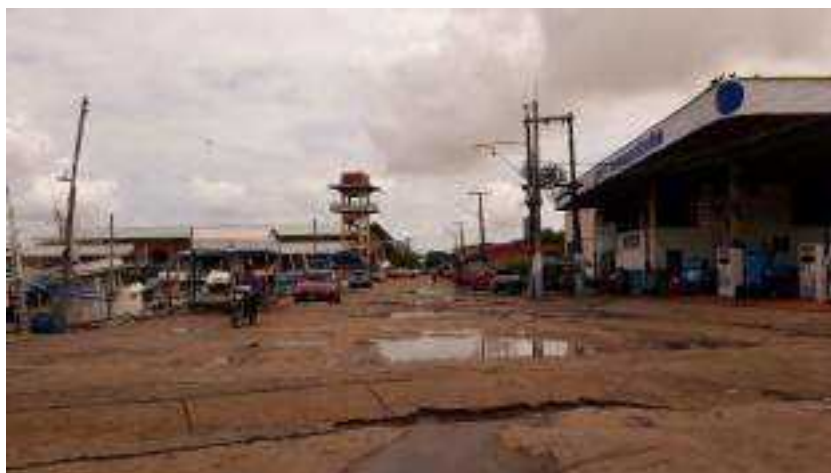
Imagem 10. O paralelo, 2023.

Dentro dessa perspectiva o ribeirurbano não abrange todas as cidades amazônicas, pois a compreensão de ribeirurbano perpassa uma “[...] forma-conteúdo de um modo de viver que compreende a presença da floresta e do rio, mas que ainda assim é urbano” (Montoia; Costa, 2019, p. 196). São cidades que passaram por um processo de urbanização intensa em que a presença da floresta é mínima, mas que há a presença de espaços que carregam traços da vida ribeirinha. A Imagem 10 registra esse paralelo do aspecto urbano da cidade e também os aspectos da vida ribeirinha na cidade.