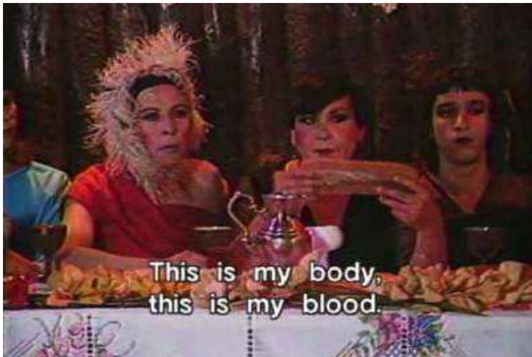
Figura 1. “La última cena”, 1989. Pedro Lemebel e Francisco Casas.

Você tem medo de que se homossexualize a vida? E não falo apenas de meter e tirar Tirar e meter Falo de ternura, companheiro O senhor não sabe Como custa encontrar o amor Nestas condições O senhor não sabe O que é carregar esta lepra As pessoas guardam distância As pessoas compreendem e dizem: É bicha, mas escreve bem É bicha, mas é um bom amigo É um cara super legal Eu não sou um cara legal Eu aceito o mundo Sem pedir que seja legal Mesmo assim