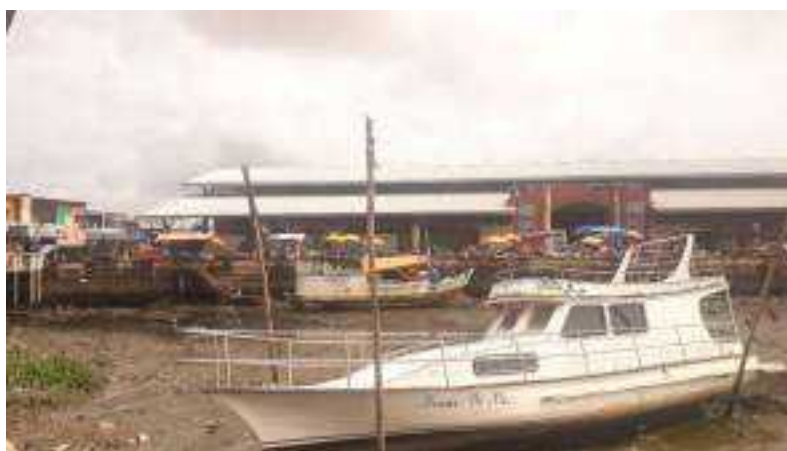
Imagem 6. Mercado de Pescado do Igarapé das Mulheres, 2023.

A feira e o porto registram na paisagem a dinâmica da cidade, seja pela hora de chegada e de partida dos barcos, seja pela lógica e forma de seu abastecimento, com produtos e fluxos notadamente locais e regionais que chegam por esses espaços. Eles dizem, de forma muito sutil, a hora que a cidade acorda, a hora que a cidade tem maior fluxo, a hora que chegam e partem os barcos, a hora que a cidade faz a sesta e a hora que a cidade vai dormir. Como relógio cotidiano, eles relevam o ritmo e o tempo da própria cidade e da própria natureza (Trindade Jr., Silva e Amaral, 2008, p. 40).