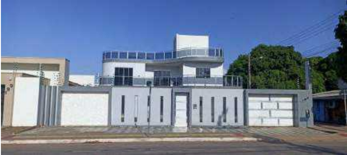
R. vila Operária, Fazendinha - Macapá, 20 de Setembro de 2024. Arquivo de pesquisa.

Os registros fotográficos abaixo ilustram essas andanças e observações sobre feições da cidade.