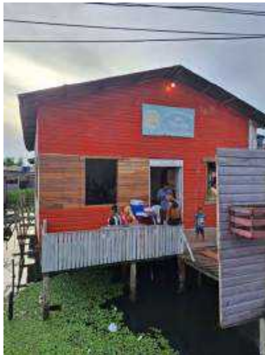
Bairro do Congós.