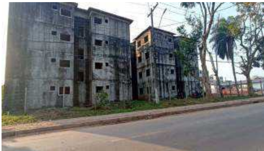
Residencial Janary Nunes (em obra), 259 R. Vila Operária, Fazendinha.

Em equipamentos habitacionais relativos a programas governamentais ou empreendimentos oriundos do capital privado, temos também formas de ocupação do espaço urbano que por vezes definem e atualizam maneiras sobre como a cidade é construída e para quem é construída.