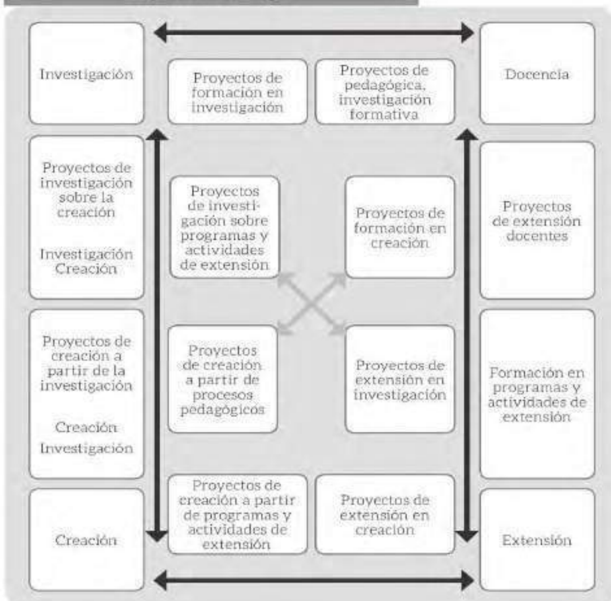
Tabla 1. Diagrama de interrelación horizontal de las funciones universitarias en la Facultad de Artes ASAB.