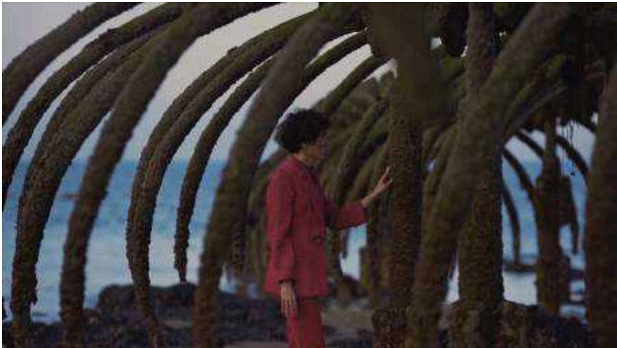
Fig. 01. Frame de A Última Imagem (2021).

(E) Seus filmes se encerram de diferentes maneiras. Em A Última Imagem acontece a cena do protagonista circulando descalço no interior do esqueleto de uma serpente marítima e GRANADA finaliza com a sequência do flamenco, com o personagem ocupando o centro do enquadramento. Ele parece reivindicar a própria presença por meio das castanholas?