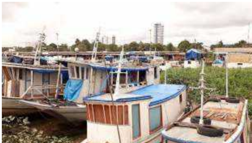
Imagem 13. As embarcações e os edifícios, 2023.

urbana como sendo “[...] a arte de tornar coerente e organizado, visualmente, o emaranhado de edifícios, ruas e espaços que constituem o ambiente urbano” (Adam, 2008, p. 63). Seguindo esse pensamento, o conceito de paisagem urbana de Cullen não abrangeria pensar o Igarapé das Mulheres como paisagem urbana.