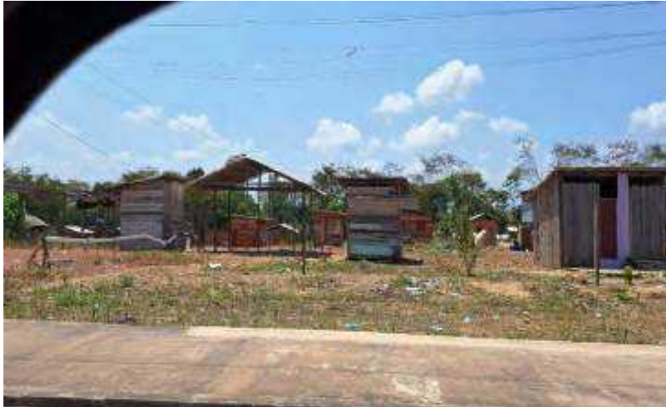
Ocupação Terra Prometida – Rodovia Morte-Sul, zona norte de Macapá.

A periferia urbana realiza as variações estratégicas, contingentes da vida, mas além disso, resolve o que é uma discursividade e visualidade sobre o que é urgente, necessário, desigual em comparações possíveis com outros cenários próximos ou mais distantes.