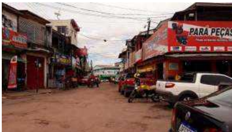
Imagem 5. Área comercial da região do porto do Igarapé das Mulheres, 2023.

Isso decorre da questão observada no campo de que é no horário da manhã que ocorre o maior fluxo dos ribeirinhos no espaço do porto, momentos em que os próprios denominam que “saltam para a terra”, seja para fazer compras ou resolver outras questões. Como existem muitos comércios e lojas no entorno do porto, como mostra a Imagem 5, acaba existindo esse fluxo de carregamento entre o comércio e a embarcação.