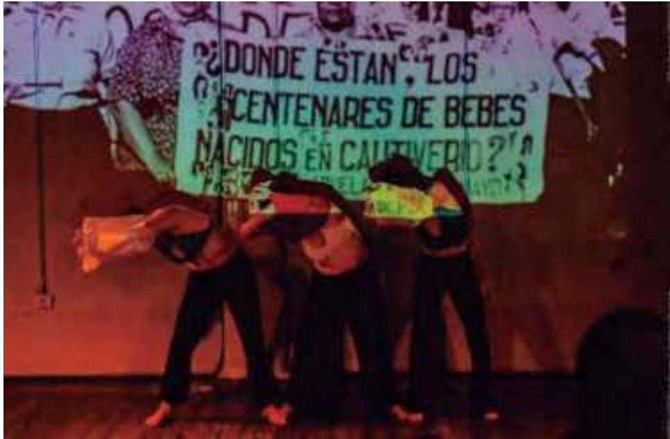
Imagem 6. “Translocadas”. Assumpción/PY-2019.