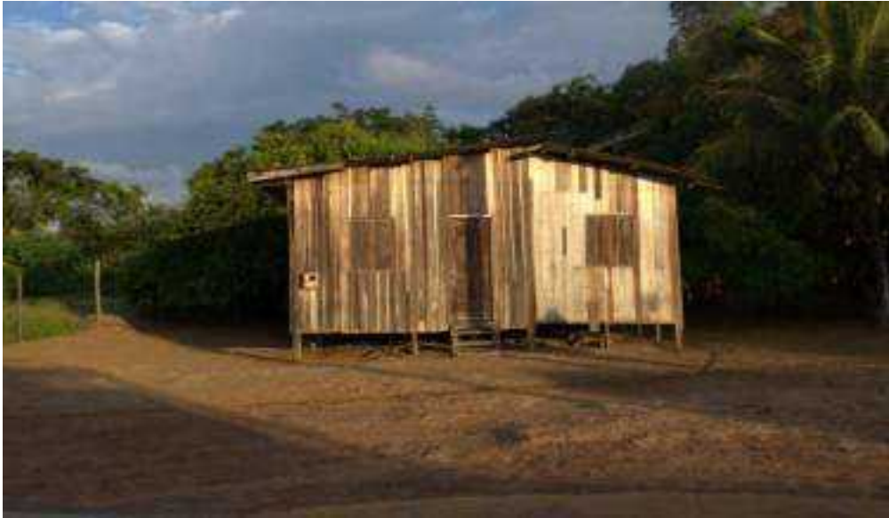
Curiaú, zona norte de Macapá. Arquivo de pesquisa.

Em meio àquilo que é possível observar, registrar e analisar, seja em lugares de terra firme, seja em localidades alagadas, a cidade assume características da ação de seus habitantes.