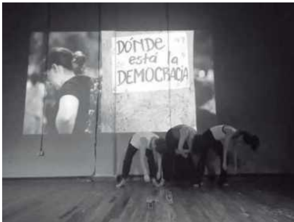
Imagem 5. “Translocadas”. Assumpión/PY-2019.

É muito relevante para este projecto localizar o conflito colombiano em relação à matriz colonial de poder para compreender o conflito e a sua violência como dimensões da ferida colonial que deve ser curada.