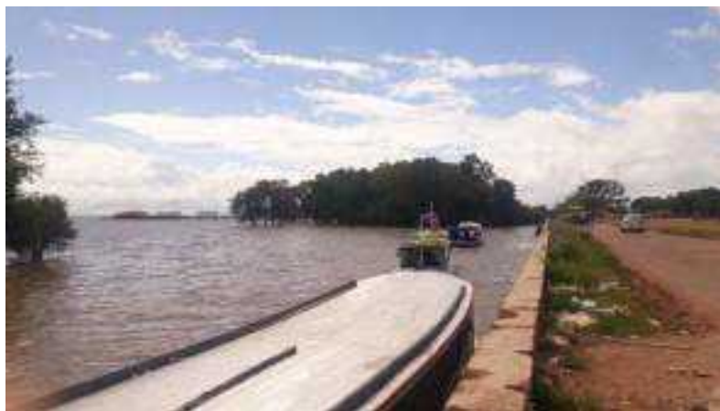
Imagem 7. O Rio Amazonas, o cais e a rua Beira-rio, 2023.

No Porto do Igarapé das Mulheres temos essa franja, é a partir da beira do cais que se tem o porto, o colorido das diferentes embarcações, os comércios, as lojas, a feira, o mercado do pescado e todos os outros elementos que compõem essa paisagem urbana. A beira do cais do Igarapé das Mulheres é parte da história da cidade, pois como já foi mencionado, foi um dos locais de chegada daqueles que migravam para a cidade de diferentes lugares e de partida, por isso a construção daquele porto e da cidade perpassa por diferentes sujeitos, amazônidas ou não.