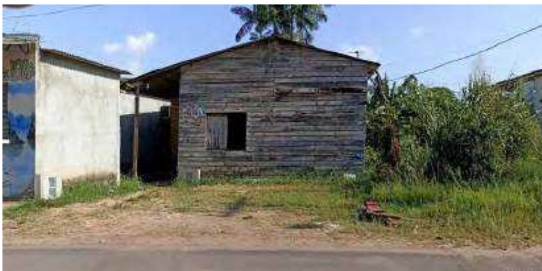
R. Nova da Praia, Fazendinha - Macapá, 20 de Setembro de 2024

As percepções dos contratantes é um exercício importante quando se está explorando a cidade em suas visualidades e formas no espaço. A cidade revela suas feições, nos arranjos possíveis do que o habitar promove sobre ser-estar e seus desafios analíticos.