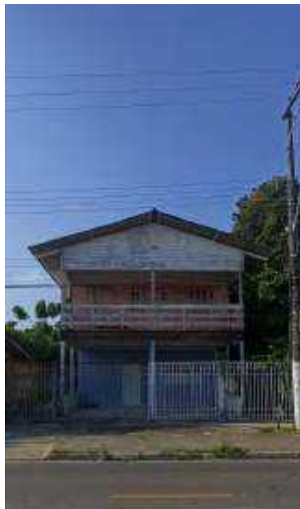
Av. Manoel Chaves de Melo, Fazendinha - Macapá, 20 de Setembro de 2024. Arquivo de pesquisa.