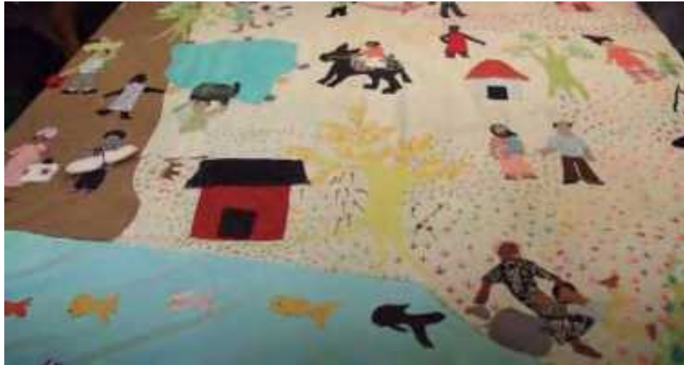
Imagem 2. Mantos de Mampujan , realizados por mulheres tecelãs tejedoras de Mampujan. Sala Memoria y Nación, Museo Nacional de Colombia.

A tese intitulada La visualidad y el campo expandido de las imágenes , de Sonia Patricia Vargas, tem como objetivo questionar linguagens e formas canônicas, curatoriais e expositivas, utilizadas em três espaços museológicos da cidade de Bogotá: a Sala Memoria y Nación del Museo Nacional de Colômbia; a exposição “El testigo”, de Jesús Abad Colorado, localizada no Claustro de San Agustín, y Fragmentos, Espacio de Arte y Memoria e Fragmentos. Desde uma perspectiva decolonial, trata-se de compreender as exposições como uma tecnologia que opera de forma interseccional, em termos de gênero, raça, classe e etnia, como determinantes nas relações de desigualdade, bem como na construção de alteridade quase sempre feminizada. Nas representações destas três exposições que serão analisadas, a vítima é referida como feminizada e como minoria em termos de etnia e classe. Nesta tese, os contributos do feminismo serão fundamentais, porque o gênero não pode ser entendido apenas como uma categoria de relações desiguais de poder, que opera entre homens e mulheres, mas também entre mulheres, como é muito claro em muitas áreas; É também fundamental para compreender as intersecções das categorias sociais e relacionais no campo das representações visuais (representações das vítimas), e também nas práticas e no exame das relações sociais e da realidade em que vivemos.