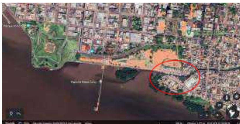
Imagem 1. Imagem de satélite da região da Orla de Macapá-AP. A área destacada compreende a região do Igarapé das Mulheres.

A construção dessa região do porto começa de forma desordenada, foi ocupada a partir do Bairro do Lagunho em direção ao Rio Amazonas numa área baixa e alagada, no hoje Bairro do Perpétuo Socorro, já foi chamada de Igarapé das Mulheres, nome dado às mulheres lavadeiras que se utilizavam desse espaço da cidade. “Este assentamento caracterizava-se por casas e pontes de madeira sobre palafitas, pois estava sobre uma várzea. A população era de origem ribeirinha com comportamentos e modo de vida simples [sic] que traziam das ilhas do Pará (AMAPÁ, 2014)” (Costa, 2015, p. 45).