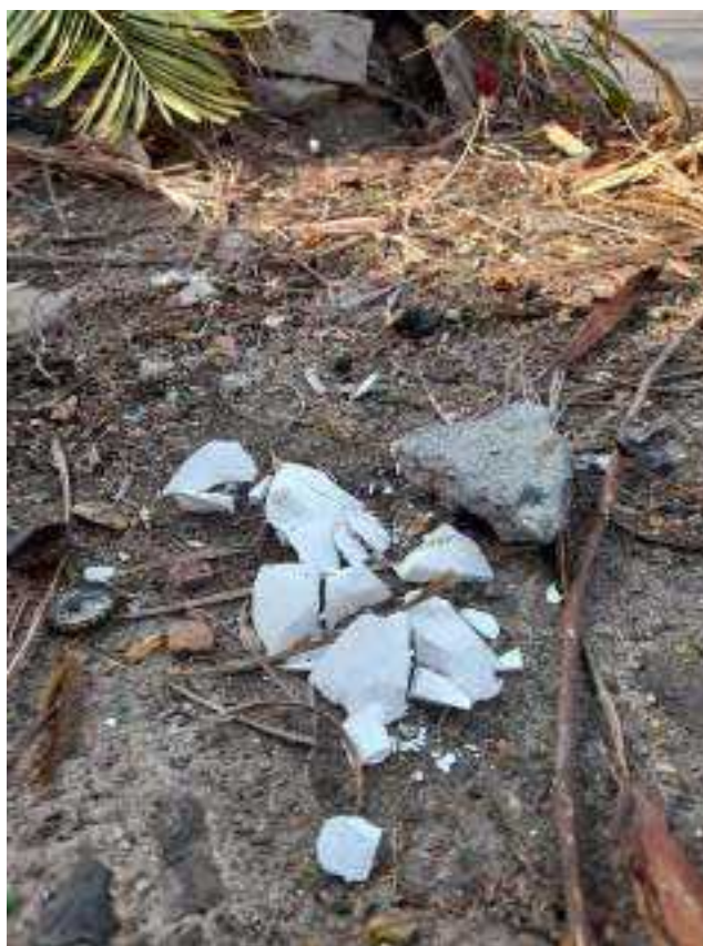
Imagem 05: Catuscia Dotto. Acorpar I . Vista do monumento após a ação de instauração e destruição, San Pedro Sula, Honduras, 2023.