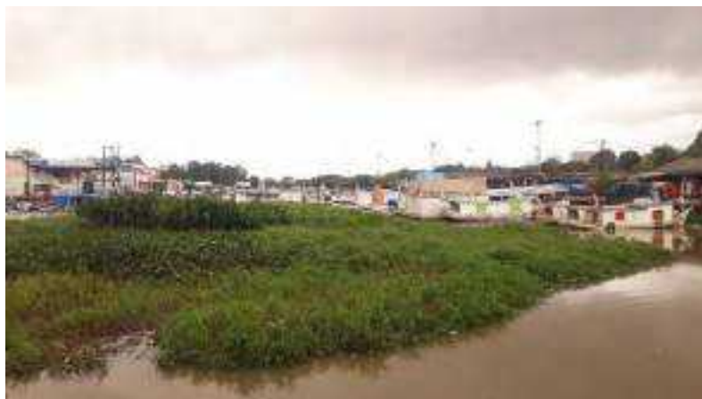
Imagem 8. O descaso com o igarapé, 2023.