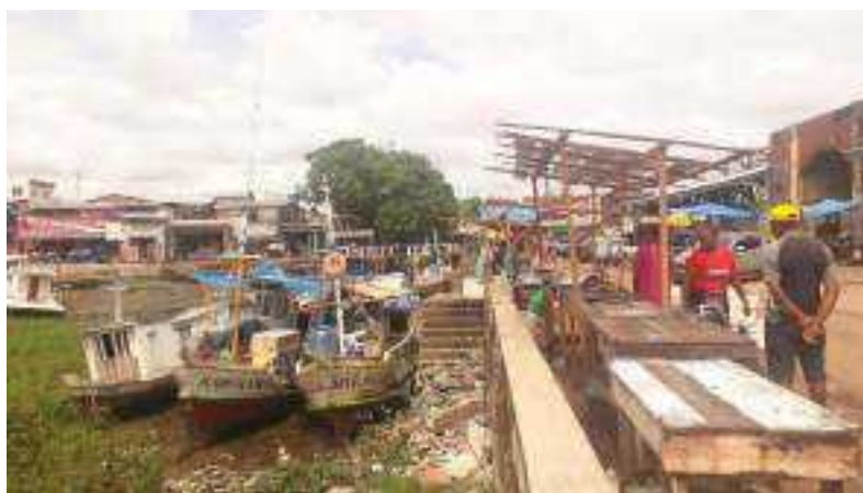
Imagem 9. O descaso ambiental, 2023.

Esse descaso ambiental é parte do descarte incorreto de lixo que advém do lixo do comércio, dos resíduos de vendas na feira, etc. que é produzido e descartado de forma incorreta pelos próprios sujeitos que ali utilizam do porto e proximidades.