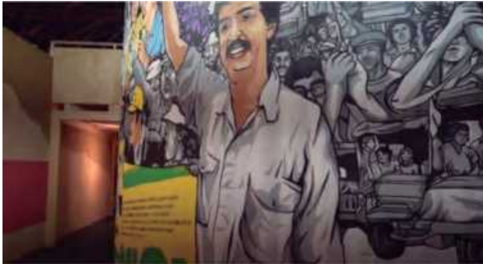
Imagem 3. Imagens da exposição “Vocês para transformar a Colômbia”. Centro Nacional de Memória Histórica (2018)