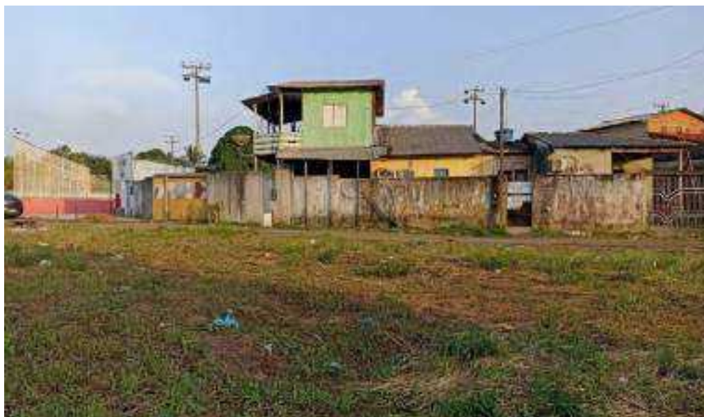
Bairro de Fazendinha, região sul de Macapá. Arquivo de pesquisa.

Compete a(o) pesquisador-pesquisadora, no privilégio de viver e ver a cidade, se deixar levar naquilo que a cidade revela. As mais diversas formas de habitação, vistas a partir das fachadas das habitações são registros de lugares da cidade que podem ser encarados diante de variáveis de acessos, poder econômico, presença ou ausência do poder público, iniciativas coletivas e ainda os resultados onipresentes da especulação imobiliária.