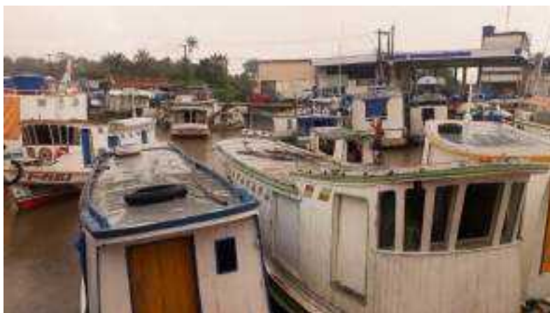
Imagem 3. Cotidiano de partida do porto, 2023. Fotografia de Antônio Carlos Lobato Nery.

A Imagem 3 dentre das diversas cenas registradas no campo, representa uma imagem cotidiana daquele espaço, o movimentar de saída da embarcação onde ao meio da imagem mostra uma criança puxando a embarcação para o meio do canal do igarapé para facilitar a saída da mesma.