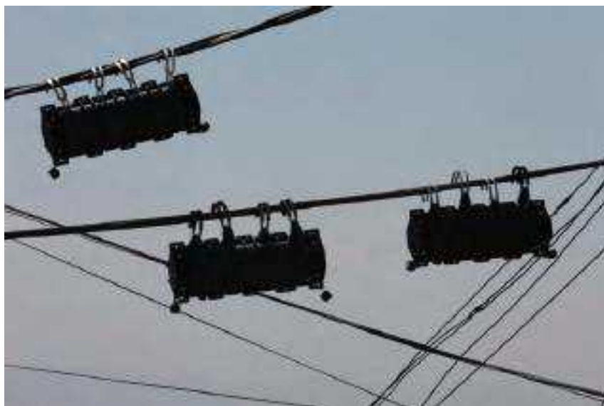
Imagen 1. Gilberto Esparza, 2014, Parásitos urbanos , en: https://revistacodigo.com/documental-parasitos-urbanos-de-gilberto-esparza/

Interesado por los mecanismos de adaptación y defensa de los elementos naturales en las ciudades, así como por el desplazamiento autónomo de los organismos vivos, trabajó en 2007 con Perejil buscando al sol . Para el proyecto, sembró la planta en macetas motorizadas, adosadas con celdas fotovoltaicas; su objetivo fue proveerle al perejil la capacidad de moverse en espacios interiores, hasta adoptar la posición más favorable para la recepción de la energía solar. 2 En torno a los contaminantes, trabaja entre 2008 y 2014 con Plantas nómadas , en este caso, las plantas tienen una prótesis robótica compleja que tiene por misión tomar agua contaminada de ríos, purificarla con bacterias limpiadoras que producen su propia energía, reposar mientras realiza el proceso metabólico y habilita su reserva energética; para después hidratar a sus propias plantas y reiniciar el microproceso