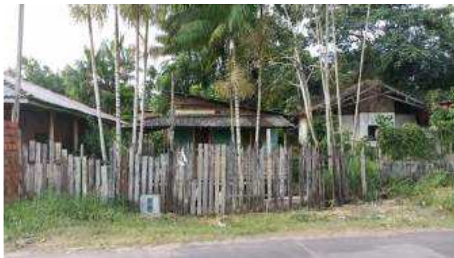
Rua Nova da Praia, fazendinha – Macapá.

De toda forma a cidade cresce, os espaços são ocupados, as habitações, enquanto formas e referências da ocupação humana nos contextos da cidade, mostram suas possibilidades e convenções. A força humana para a mudança de cenários repercute nas imagens sobre a cidade. As variáveis para se observar a cidade nesses processos ensejam também participar da vida urbana, acompanhar o que ocorre.