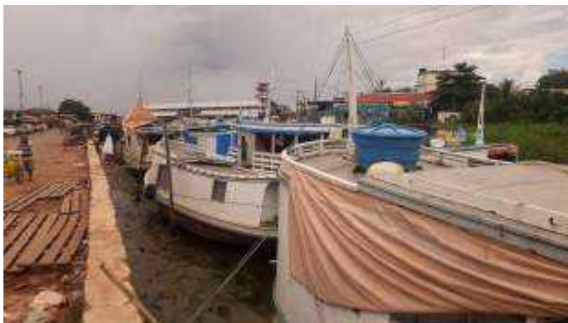
Imagem 12. A paisagem cotidiana no Igarapé das Mulheres, 2023.

Dessa forma, a paisagem do porto do igarapé das mulheres diz um pouco da especificidade de uma forma urbana ribeirinha. Como pontua Mendes (2016), a paisagem se torna essa percepção daquilo que nos cerca, o que vemos pensando aqui os diversos elementos que compõem a paisagem do Porto do Igarapé das Mulheres, a forma de ver desse nosso olhar e também de como significamos essa visão. A Imagem 12 revela essa paisagem cotidiana do porto e se diz muito sobre o porto, pois “ver os lugares ou ambientes como paisagem diz coisas profundas sobre nossa cultura” (Mendes, 2016, p.40).