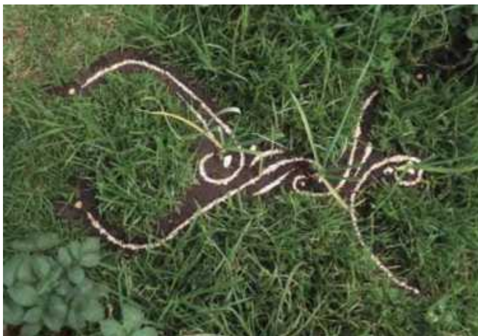
Imagem 10. Chacana de protección y Sembrado telúrico . Gary Gari Muriel (2019).