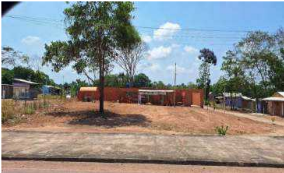
Ocupação Terra Prometida – Rodovia Morte-Sul, zona norte de Macapá.