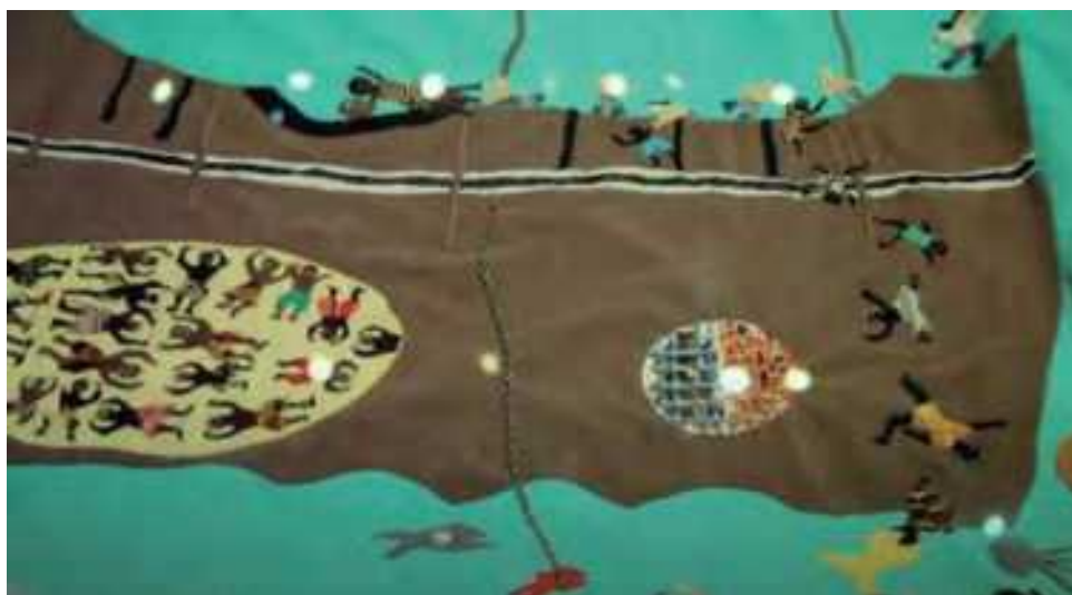
Imagem 1. Mantos de Mampujan , realizados por mulheres tecelãs de Mampujan. Sala Memoria y Nación, Museo Nacional de Colombia.

Para finalizar este texto, gostaria de fazer, a seguir, uma referência a alguns dos projetos de tese de Doutorado em Estudos Artísticos em andamento na sua primeira geração. Nestes, cada um dos autores dialoga e põe em prática, em maior ou menor grau, aspectos de reconstituição estética e de pesquisa-criação que apresentamos anteriormente. Esta é a abordagem geral 4 das teses a partir da apresentação que os alunos fizeram no início de um dos seminários do segundo semestre de 2020. Desta forma, se sustenta a nossa abordagem ao Doutorado em Estudos Artísticos como um desses espaços dentro da universidade onde é possível abrir outras possibilidades de criar, e de conhecer, desobedientes à epistemologia e à estética moderna e colonial.