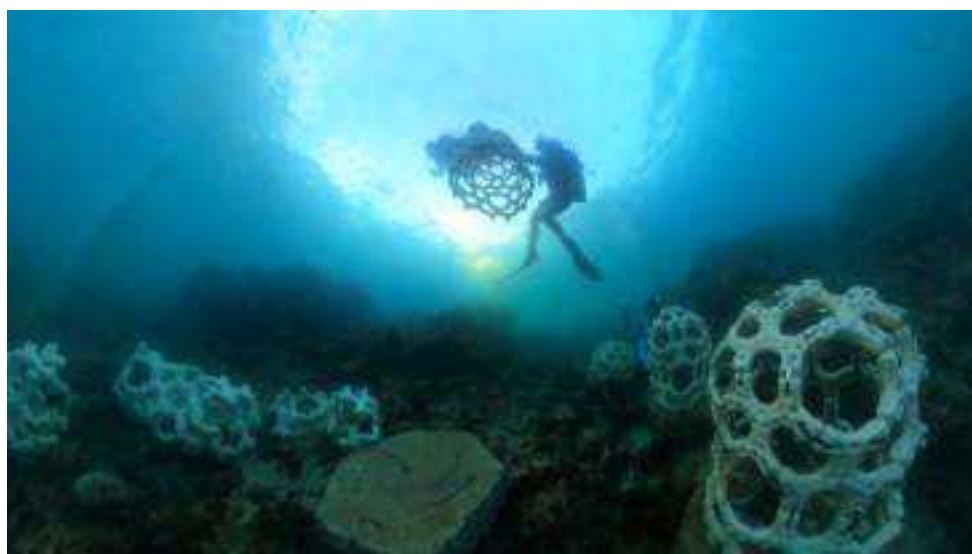
Imagen 2. Gilberto Esparza, 2023, Korallysis , en: https://gilbertoesparza.net/portfolio/korallysis/

La Manga en Guaymas, Sonora, colindando con el Mar de Cortés; el otro en Tenacatita, Jalisco, una de las bahías del océano Pacífico. 5 Sus distintas morfologías emulan a los arrecifes coralinos, estructuralmente fueron pensados como módulos ensamblables con posibilidades de adaptación al comportamiento del oleaje en cada sitio específico, o como mecanismos dóciles al contexto. El material de confección recurre a redes internas de acero inoxidable y fibras de carbón, recubiertas con cerámica horneada a altas temperaturas. A las formas articuladas de apariencia coralina se aplicaron pastas especiales y texturas para la mejor adherencia y crecimiento orgánico; asimismo, el mecanismo es capaz de generar energía con sus componentes, a través de su vértebra saliente y la corriente; de esta manera, se espera repercutir en la aceleración del proceso de mineralización y, con el excedente energético, procurar la emisión de sonidos con frecuencias armónicas para peces que se alimenten de las invasivas algas.