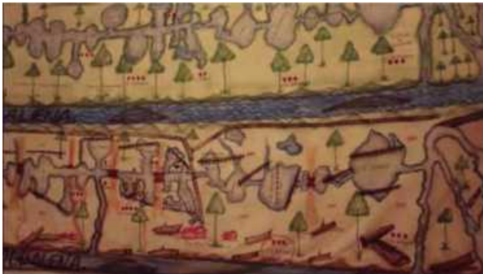
Imagem 4. Imagens da exposição “Vocês para transformar a Colômbia”. Centro Nacional de Memória Histórica (2018)