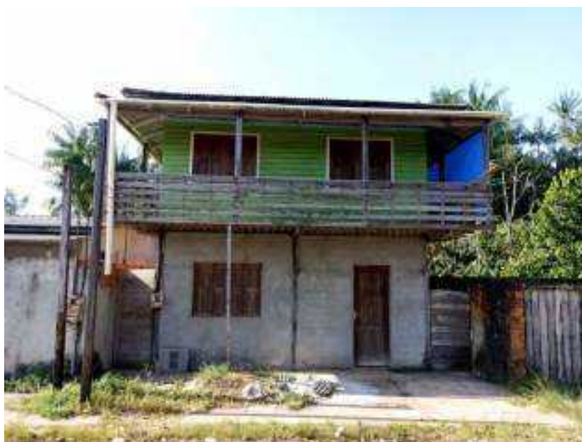
R. Nova da Praia, Fazendinha - Macapá, 20 de Setembro de 2024. Arquivo de pesquisa.

A cidade vista, em processos de treinar o olhar sobre os arranjos de fachadas de residências, equipamentos e comércios mostram maneiras diversas sobre como a vida urbana ocorre. Nesse sentido, importante destacar que o andar, na curiosa contemplação das paisagens habitacionais, por vezes revela uma cidade estruturada, por outras vezes repercute imagens das carências estruturais ou arranjos possíveis diante das condições econômicas dos cidadãos. Seja em casas completamente de alvenaria, sejam nas casas híbridas (alvenaria e madeira), ou apenas em madeira, o que temos são formas diversas de viver a cidade, evidências do direito à cidade e suas repercussões, certamente.