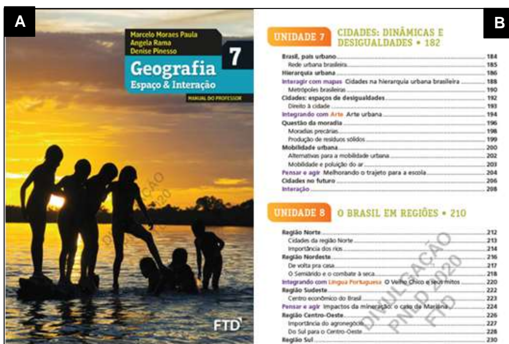
Figura 2 - Geografia Espaço & Interação, volume 7: (A) Capa e (B) Sumário