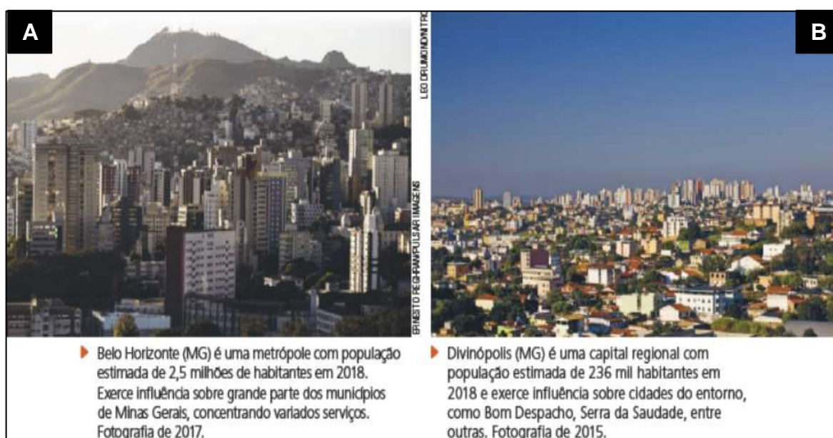
Figura 4 - Hierarquização Urbana, cidades mineiras

Outro aspecto exposto no texto do livro aqui analisado está relacionado às definições de hierarquia urbana. A imagem da Figura 4 ilustra essa hierarquia mostrando duas cidades do estado de Minas Gerais, da região sudeste do país: Belo Horizonte (Figura 4-A, capital do estado) e Divinópolis (Figura 4-B). A primeira, uma das metrópoles brasileiras, exerce influência em grande parte dos municípios do estado, pois concentra a prestação de vários serviços em diversas áreas, como educação e saúde. A segunda, uma capital regional, que influencia cidades vizinhas menores que estão em seu entorno, também com a prestação de vários serviços, principalmente na área social.