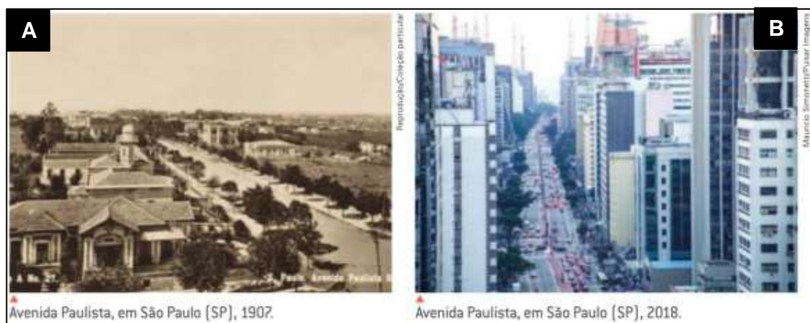
Figura 8 - Expansão urbana no contexto da Avenida Paulista (A) 1907 e (B) 2018)