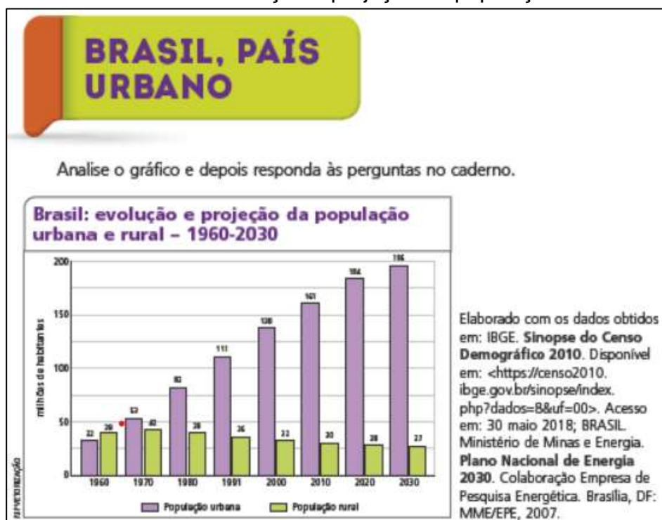
Figura 3 - Gráfico sobre a evolução e projeção da população urbana no Brasil