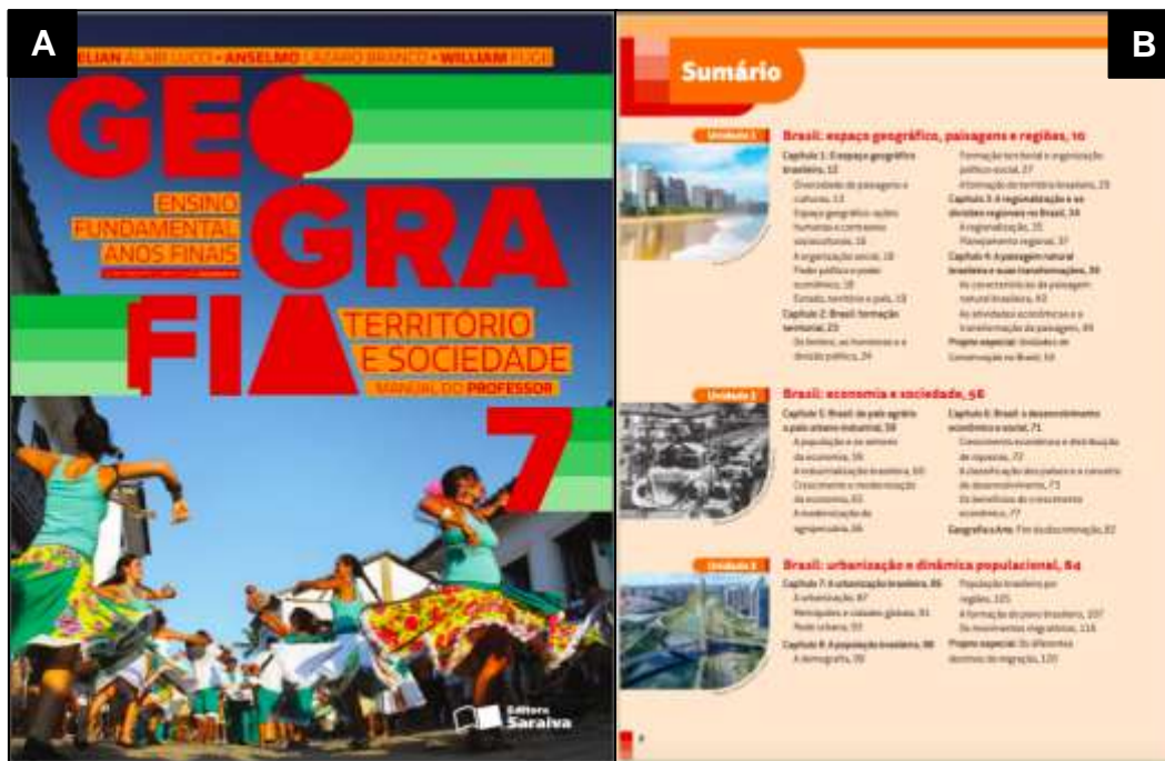
Figura 6 - Geografia: Território e Sociedade, volume 7: (A) Capa e (B) Sumário

avaliá-lo nesta temática. Com isso a análise será restrita ao livro do sétimo ano (Figura 6).