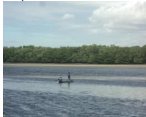
Figura 04 - Pescadores no rio Ceará.