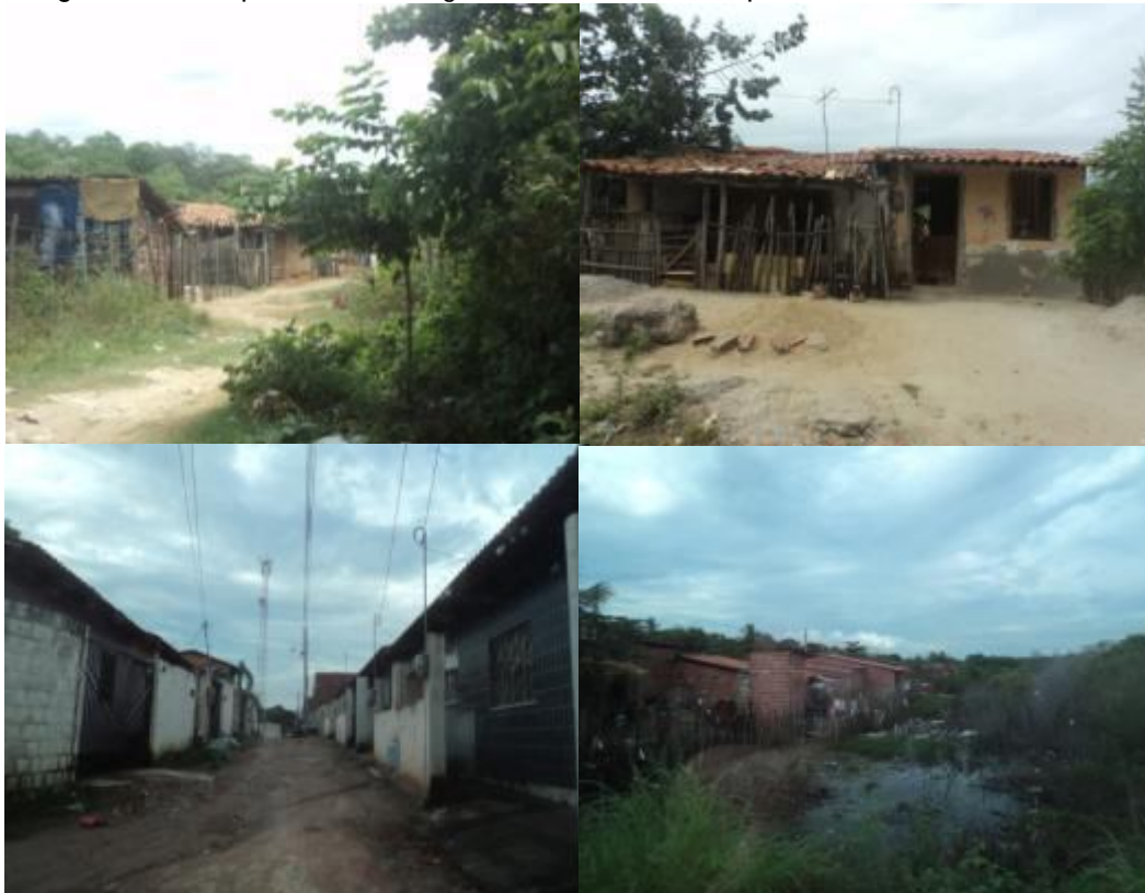
Figura 02 - Composição de fotografia com diferentes tipos de habitações no Guaié.