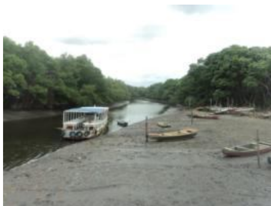
Figura 06 - Barcos para passeio e pesca.