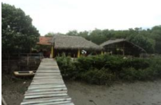
Figura 05 - Recanto do mangue.