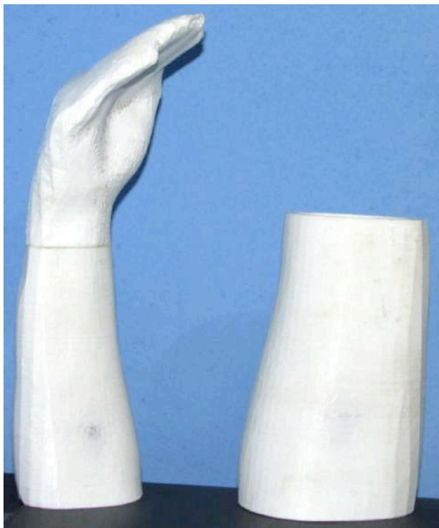
Figura 3 – Fotografia do primeiro braço impresso

Na 2ª etapa: Tivemos contato com a primeira impressão e verificação da proporção dos membros escaneados, os quais precisavam de ajustes para que tivessem um tamanho considerado interessante para dispor na parede.