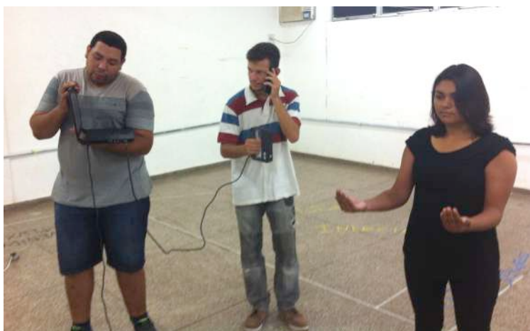
Figura 2 – Fotografia do processo de escaneamento digital