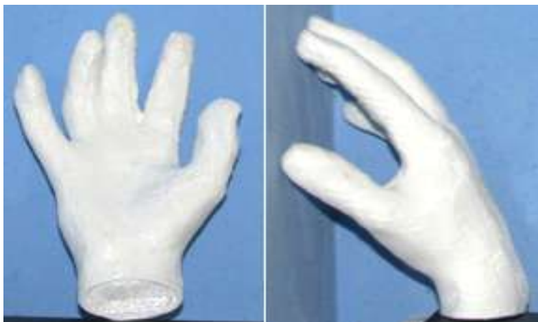
Figura 4 – Fotografia da mão

Na 3ª etapa: Fomos ver parte da obra na sala do projeto Robótica Tucuju, braços e mãos foram medidos novamente, pegamos uma mostra de parte do braço que deu errado segundo o grupo, por falta de medida da altura como amostra de como irão ficar as peças impressas.