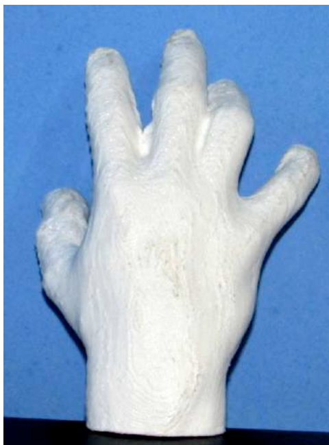
Figura 5 – Fotografia da última análise da mão

Na 4ª etapa: Fizemos a verificação do andamento da impressão em 3D dos braços com medidas acertadas, os quais estão sendo impressos em definitivo pelo grupo de Robótica Tucuju para posterior montagem e finalização da obra.