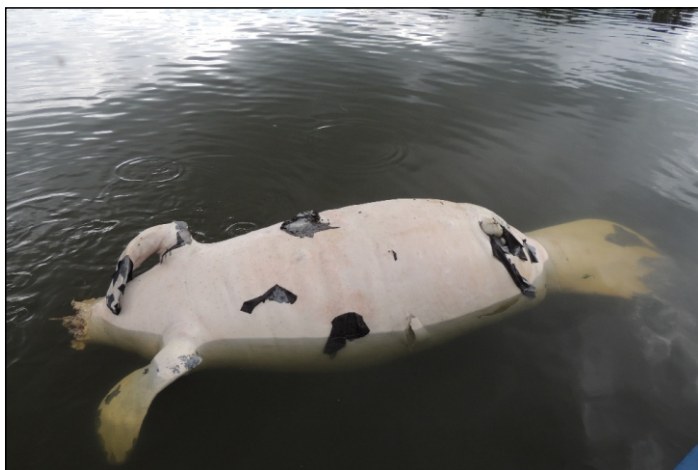
Figura 2. Carcaça do macho adulto de peixe-boi-amazônico ( Trichechus inunguis ) encontrado no Furo Três Irmãos, Tabuleiro do Embaubal, baixo rio Xingu, Pará. / Figure 2. Adult male carcass of Amazonian manatee ( Trichechus inunguis ) found inside the Furo Três Irmãos, Tabuleiro do Embaubal, lower Xingu River, Pará state, Brazil.

Após este evento, entrevistas foram realizadas na região das ilhas no Tabuleiro do Embaubal e ao longo de todo o trecho de monitoramento a fim de obter informações sobre o ocorrido. A média de idade dos entrevistados foi de 58 anos (DP = 9,3) e um índice de 70% de analfabetismo. Segundo um dos entrevistados, o peixe-boi foi avistado ainda vivo no dia anterior por moradores do Furo do Tamanduá (Figura 1) nadando na superfície, comportamento dificilmente observado para a espécie devido a visibilidade da água ou por questões de estratégias de autoproteção (ROSAS, 1994). Temendo que a notícia de captura pudesse se espalhar, os moradores que avistaram o peixe-boi ainda vivo decidiram não capturar o animal, segundo eles já aparentemente frágil.